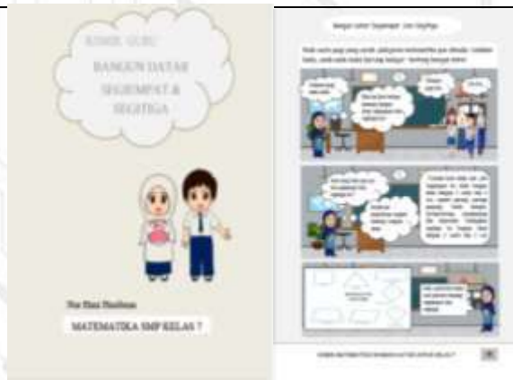
Gambar 2. Buku Siswa Setelah Dikembangkan

Berdasarkan pretest yang dilakukan peneliti, kemampuan pemecahan masalah matematis siswa berada pada kategori cukup. Berikut hasil tes kemampuan pemecahan masalah matematis siswa pada pre test yang di berikan dapat dilihat pada gambar 3berikut: