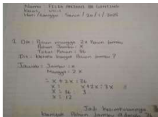
Gambar 1. Lembar Jawaban Siswa

Rendahnya kemampuan pemecahan masalah matematis siswa dilihat dari jawaban soal observasi siswa tersebut. Kesalahan siswa di temukan pada indikator-indikator kemampuan pemecahan masalah matematis pada gambar 1 berikut ini: